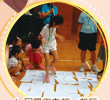
▲同學與老師一起玩刺激的遊戲