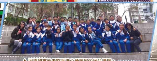
△ 同學們實地考察香港公營房屋的居住環境。