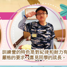
◀訓練營的特色是對紀律和耐力有嚴格的要求，喜見同學的成長。