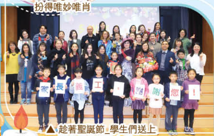
▲趁著聖誕節，學生們送上對家長義工的心意