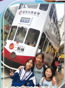
△ 港島區獨有的「叮叮」，很有特色呢!