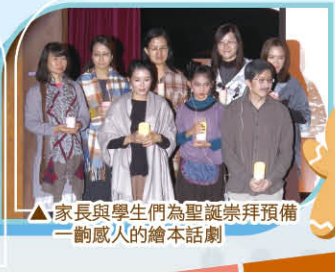
▲家長與學生們為聖誕崇拜預備一齣感人的繪本話劇