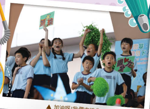
▲加油呀!我們支持你!