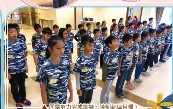
▲同學努力完成訓練，達到紀律目標。