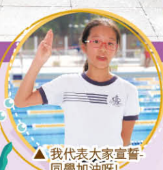
▲我代表大家宣誓，同學加油呀!