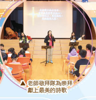
▲老師敬拜隊為崇拜獻上最美的詩歌