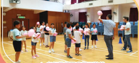
▲老師帶領同學們玩遊戲