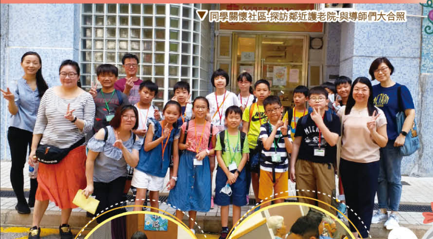
▼同學關懷社區：探訪鄰近護理院與導師們大合照

本年度主題是「認識耶穌Fun Fun Fun——作個平安及智慧的孩子」，團契內容豐富和多元化，而且活學活用，讓學生實踐真理。活動包括：遊戲、見證、詩歌及生日會等，團契亦會進到社區，到護理院探訪，關懷區內長者。歡迎同學加入愛與信團契的大家庭！耶穌愛您，祝福您！