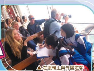
△ 在渡輪上與外國遊客進行訪問和交談