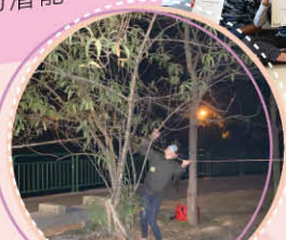
▲透過生死線活動，提升團隊溝通及自信心。