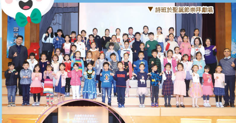
▼詩班於聖誕節崇拜獻唱