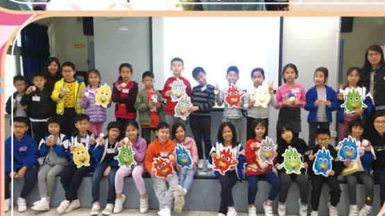
▲以百變小怪獸作營會主題，提高學生情緒表達的能力。