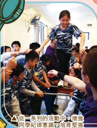
▲從一系列的活動中，增強同學紀律意識，培育堅強意志，鍛鍊健康體質，是一次難得的人生歷練。