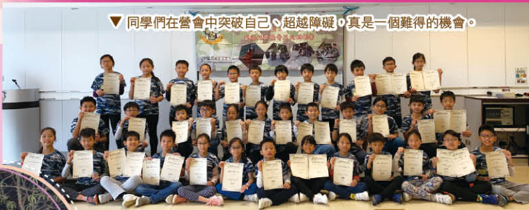
▼同學們在營會中突破自己，超越障礙，真是一個難得的機會。