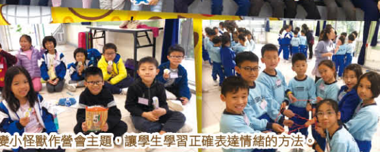
▲以百變小怪獸作營會主題，讓學生學習正確表達情緒的方法。