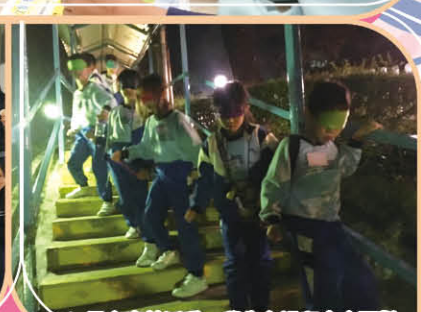
▲黑夜森林活動，學生在過程中會面對重重難關，最後成為真正的勇者。