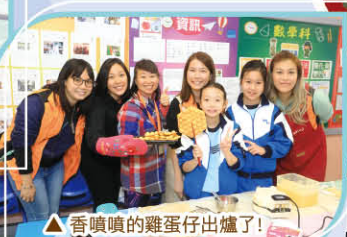
△ 香噴噴的雞蛋仔出爐了!