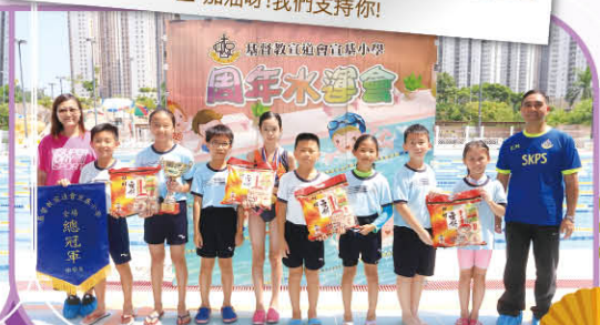
▲努力打氣是有回報的