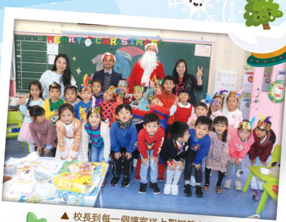
▲校長到每一個課室送上聖誕節心意