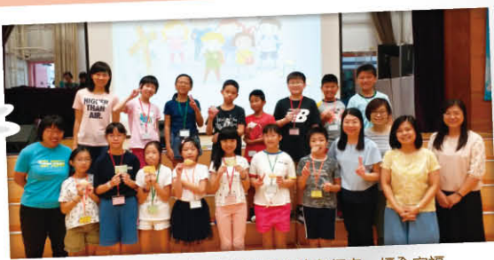
▲愛與信團契成員與負責周會的老師來一幅全家福