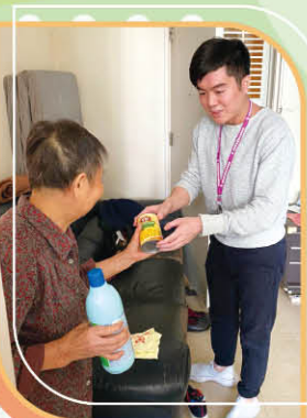
愛心關懷宣基堂：罐頭捐贈