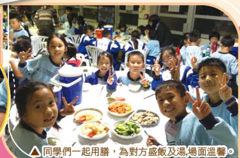
▲同學們一起用膳，為對方盛飯及湯，場面溫馨。