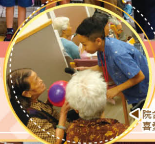
▲院舍長者十分欣賞及喜愛同學預備的遊戲