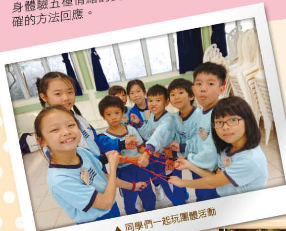
▲同學們一起玩團體活動

營會以「百變小怪獸」作為軸心，小怪獸身上有五種顏色，分別代表不同情緒：黃色——快樂、紅色——憤怒、藍色——傷心、黑色——害怕、綠色——平靜。透過經驗學習法，讓學生親身體驗五種情緒的變化，然後學習控制和運用正確的方法回應。