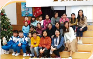
▲多謝老師們的分享，學生在團契的情誼大增