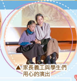
▲家長義工與學生們用心的演出