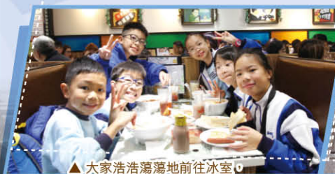
△ 大家浩浩蕩蕩地前往冰室，品嚐本土特色早餐。