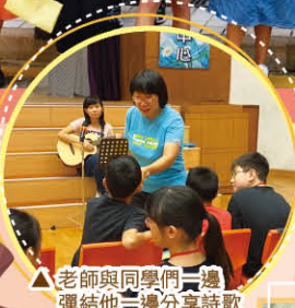
▲老師與同學們一邊彈結他一邊分享詩歌